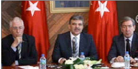
EXPO 2015 İzmir adaylığı sunumu için Paris'te bulunan Cumhurbaşkanı Abdullah Gül, Fransa Başbakanı François Fillon'u Türkiye Paris Büyükelçiliğinde kabul etti. Yaklaşık 1 saat süren görüşme ardından Gül, basın toplantısı yaptı. Toplantıda Devlet Bakanı Mehmet Aydın (solda) ve Paris Büyükelçisi Osman Korutürk de (sağda) katıldı.

ANKARA - AA muhabirine bilgi veren AÜ Tıp Fakültesi Çocuk Genetik Bilim Dalı doktorlarından Mustafa Tekin, başkanlığını yürüttüğü ekibin, 6 yıldır Türkiye'de işitme kayıplarının genetik ne-