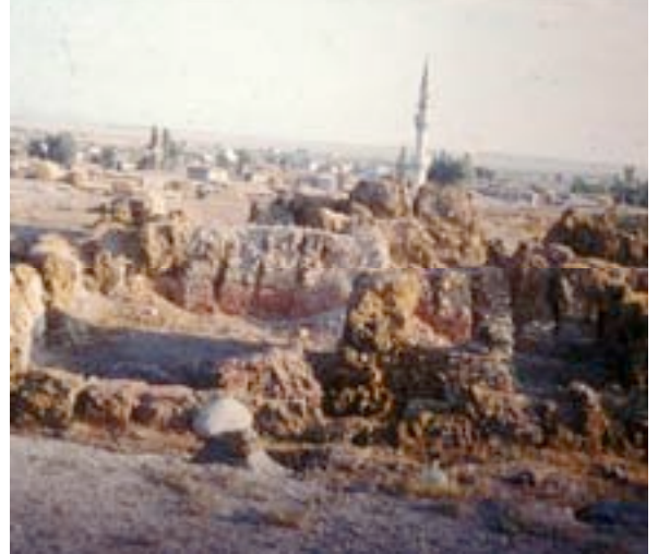
2007 yılı kazılarına başlarken, koloni çağıının en parlak döneminin yaşandığı MÖ 1850 ile 1780 yılları arasındaki 3'üncü kat binasının bir bölümünü açığa çıkartılması hedefleniyor.

Öztan, Acemhöyük kazısına önümüzdeki yıl devam edileceğini söyledi.