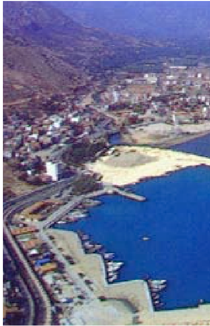
Finike Marina Müdürü Tuncay Özses, yaptığı açıklamada, yılbaşından bugüne kadar kısa sürelili ya da günlük konaklayan 3 bin yatçıyı ağırladıklarını belirterek, limanın 350 yatçıya da daimi hizmet verdiğini bildirdi.