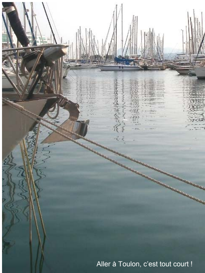
Aller à Toulon, c'est tout court !