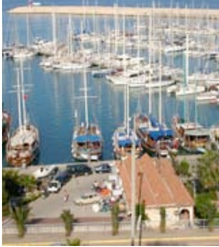
Mavi Bayrak unvanına da taşıyan Finike Yat Limanı, hizmet vermeye başladığı 1997 yılından bu yana, yerli ve yabancı yatçıların uğrak yeri haline geldi.