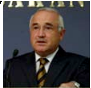
Çiçek, terörü her yönüyle ciddiye aldıklarını ve hükümet olarak tüzeltmeye çalıştıklarını belirtirken, eskisine göre daha çıkan insan sayısında azalma olduğunu bildirdi.

● Yüksek Askeri Şura, Başbakan Recep Tayyip Erdoğan'ın başkanlığında 29-30 Kasım tarihlerinde toplanacak. Yılın ikinci olağan toplantısında, başta personel, eğitim, disiplin konuları olmak üzere Türk Silahlı Kuvvetleri'nin (TSK) planlı faaliyetleriyle ilgili değerlendirmelerde bulunulacak. (Haber 7'de)