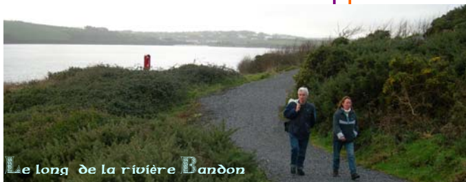
Le long de la rivière Bandon