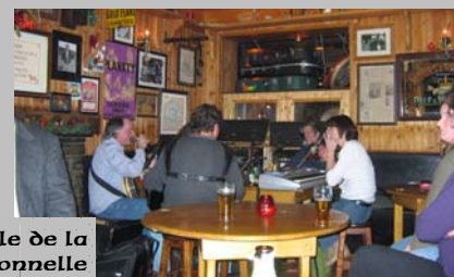
Doolin, capitale de la musique traditionnelle

nous sommes très prudents le soir sur les trottoirs du retour !