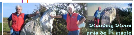
Standing Stone près de Kinsale