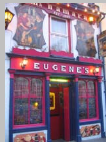
Dans le centre d'Ennistimon