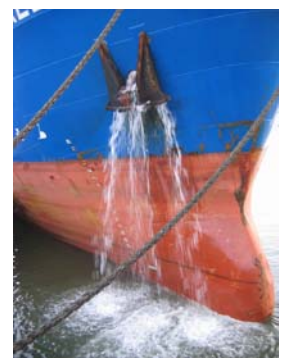
Ca va encore faire couler beaucoup d'encre

Seule la harpe ne se plaint pas : elle n'aime pas la chaleur, mais apprécie l'humidité, en digne fille des pays de Gaël.