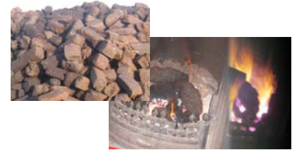
Odeur de tourbe, combustible irremplaçable