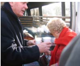
Distribution de vin chaud le 25 décembre

Les Irlandais ont semble-t-il un rapport très particulier avec le travail et les horaires. Ils disent eux-mêmes que la montre « irlandaise » n'est pas la même que partout ailleurs. Les retards sont habituels et bien acceptés, que ce soit pour le loisir ou pour le travail. Les bus sont en avance ou en retard sur leurs horaires, trouver une horloge publique à l'heure relève de l'exploit, les boutiques sont parfois fermées plusieurs jours, ou ouvertes le dimanche, sans raison apparente, les rendez-vous sont déplacés sans souci. Mais un Irlandais au travail par contre ne relève pas la tête, très concentré, stressé, sans doute peu habitué à la vie effrénée que nous menons depuis longtemps sur le continent. Ce qui ne l'empêche pas pour autant de garder toujours son sourire et sa gentillesse.