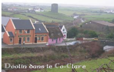
Doolin dans le Co-Clare

On nous a raconté qu'une simple petite barquette louée pour un jour, était partie pour une navigation vers Baltimore (à 40 milles à l'ouest de Kinsale) a été retrouvée après de coûteuses recherches par le